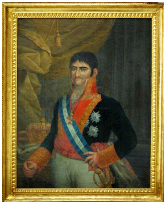
Retrato de Fernando VII José Camarón y Meliá. 1814 Museo Diocesano de Tui-Vigo

A historia da Guerra de Independencia española ten o seu inicio no ano 1807, baixo o reinado de Carlos IV. Napoleón, aliado do noso país, co pretexto de atacar Portugal (aliada dos ingleses e inimiga polo tanto de Francia) atravesa a península coas súas tropas e invade España en 1808. O seu plan, unha vez ocupada España, é substituír a dinastía Borbónica por un membro da súa propia familia. O rei Carlos IV permite a entrada do exército francés e, convencido por Napoleón, trasládase coa súa familia a Baiona (Francia), circunstancia que aproveita o emperador para coroar ao seu irmán Xosé Bonaparte, “Pepe Botella”, como rei de España.