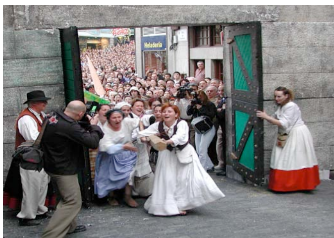
Festa da Reconquista. Casco Vello, 2004.

No período da Reconquista os que mandaban foron acusados de afrancesados e substituídos por Vázquez Varela como alcalde da vila e Villavicencio como gobernador militar.