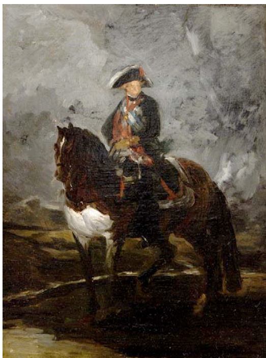
Bosquexo do retrato de Carlos IV a cabalo Francisco de Goya. Atrib. Ca. 1800 Museo Municipal de Vigo Quiñones de León NºINV 452