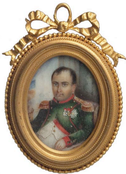
Nº Inventario: 4523. Descoñecido Napoleón Bonaparte. Francia Acuarela sobre marfil. 3 x 2.5 cm Museo municipal de Vigo “Quiñones de León”

(Para ampliar ver Material didáctico 3: A época napoleónica)