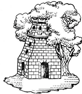
ESCUDO DE VIGO COMO CIDADE

A exemplar acción da vila foi recoñecida como era de xustiza. Con data 1 de marzo de 1810, o Consello de Rexencia de España e Indias, establecido en Cádiz, concede á ata entón vila de Vigo “o privilexio e título de Cidade Fiel, Leal e Valorosa, en atención aos sinalados servizos, heroica lealdade e esforzado denodo manifestado polos seus veciños na defensa da xusta causa da independencia nacional, relevándoa do pago de todo xénero de servizos por esta graza”.